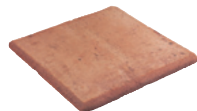
Gradino ad angolo