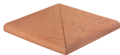
Gradino ad angolo