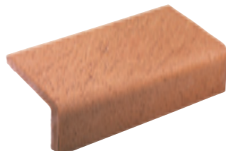
Elemento ad L