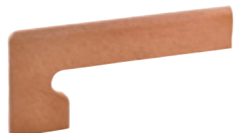
Battiscopa per gradino stondato