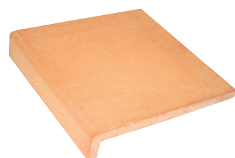
Gradino a L Altezza bordo 5mm